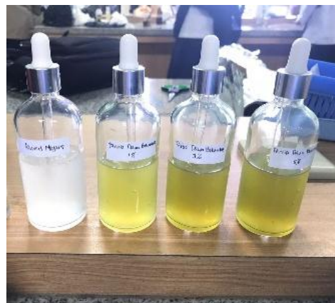
Gambar 1. Formula serum wajah

Sediaan serum diyakini lebih efektif dan cepat meresap ke dalam kulit dibandingkan dengan pelembab atau krim. Evaluasi sediaan serum bertujuan untuk mengetahui kestabilan fisika dan kimia sebelum dan sesudah cycling test sesuai tabel 4 dan 5.